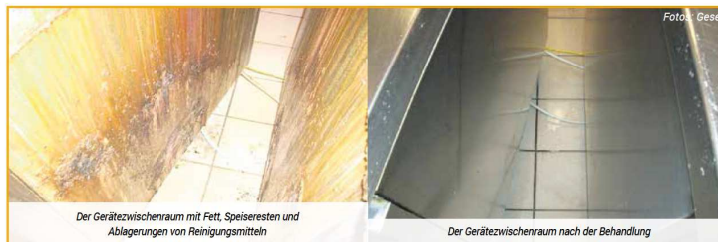
Der Gerätezwischenraum mit Fett, Speiseresten und Ablagerungen von Reinigungsmitteln

Ein Elektriker sorgt am Schluss für eine einwandfreie Funktion aller Geräte und Maschinen. Die technische Tiefenhygiene unterstützt damit auch den Werterhalt der Küchenausstattung. Natürlich löst eine Inkrustierung allein noch keinen Lebensmittelskandal aus. Der Verantwortliche darf sie als Marker ansehen, als äußeres Signal für die Notwendigkeit tiefenhygienischer Maßnahmen. Gesec Hygiene + Instandhaltung empfiehlt diese in Intervallen von ein bis zweimal Mal jährlich – je nach Nutzung, Intensität und allgemeinem Hygienestandard. (max)