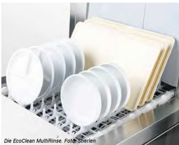
Die EcoClean MultiRinse.

Immer hygienisch glänzende Spülergebnisse – Klarspülung und Trocknung tragen im Spülvorgang gemeinsam zu hygienisch glänzenden Spülergebnissen bei. Hersteller Stierlen hat seine Bandtransportmaschinenserie EcoClean MultiRinse deshalb zusätzlich zur MultiRinse-Klarspülzone mit der neuen ARC-Trockenzone ausgestattet. Die patentierte Klarspülzone überzeugt mit ihrer Frischwas-